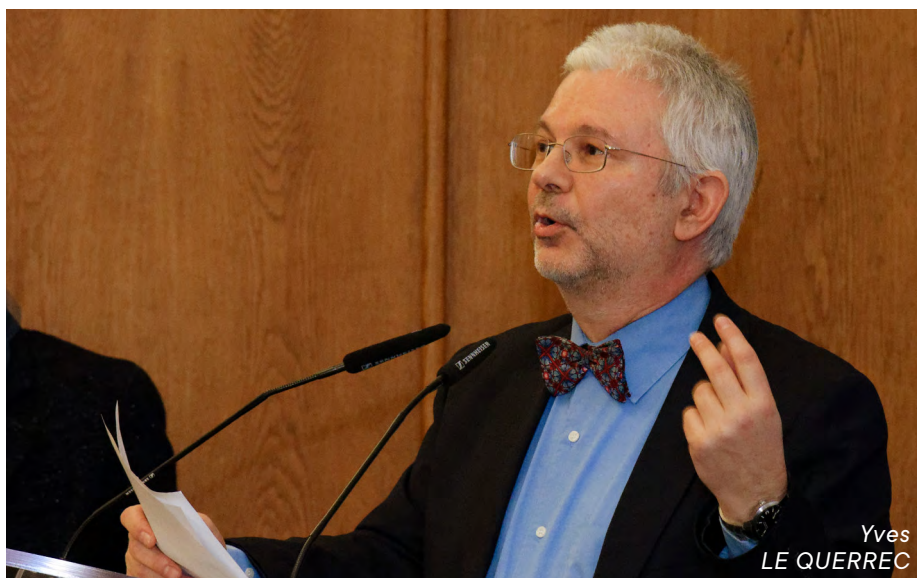
Yves LE QUERREC